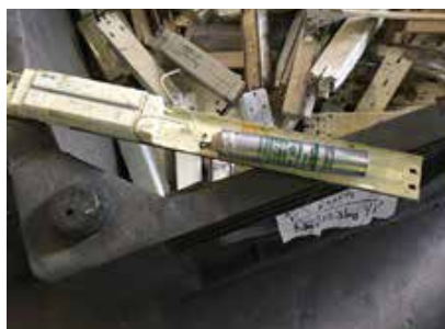
VG in einem separaten Gebinde lagern, danach VG mit Kondensator aussortieren.

Es gibt VG in sehr vielen verschiedenen Typen, Grössen und Formen . Nicht in jedem VG befindet sich immer ein verdächtiger Kondensator. Aber wenn ein Kondensator vorhanden ist, enthält er wahrscheinlich PCB. Es gilt also, auf Nummer sicher zu gehen: lieber ein VG zu viel als zu wenig aussortieren .