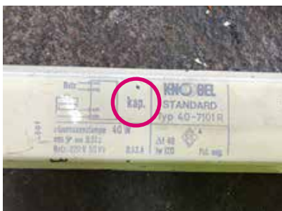
Bezeichnung «kap.» deutet auf die Anwesenheit eines Kondensators (kapazitiver Teil) hin.

Mögliche Hinweise und Merkmale für einen PCB-haltigen Kondensator in einem VG: