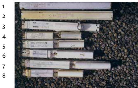
Abb. 1a: Kapazitive Vorschaltgeräte der Firma Knobel, Ennenda.