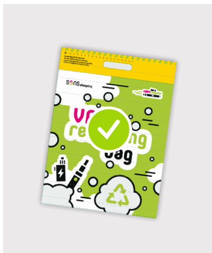
Vape Recycling Bag