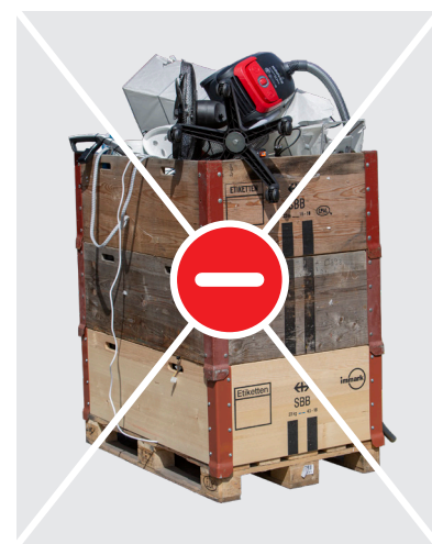
Paletta con tre telai (sovraccarica)